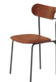
コトル DG-3N ¥27,100 張材:レザー-B-29 (No.2)