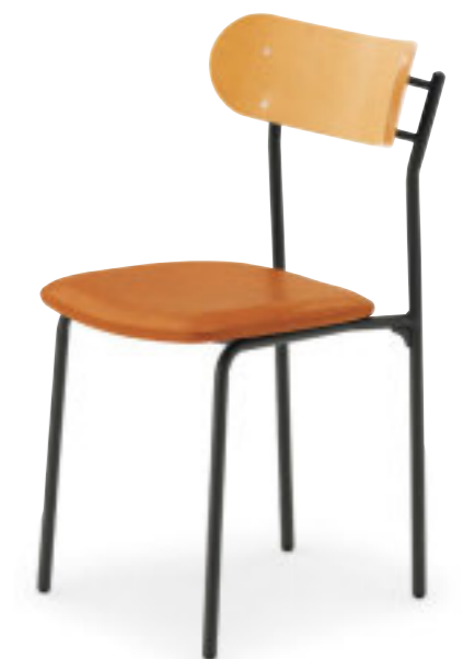
コトル DG-5N ¥27,100 張材:レザー-B-29 (No.1)