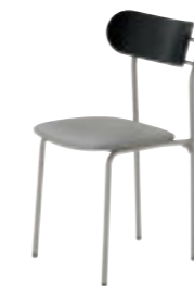
コトル SI-6T ¥27,500 張材:レザー-C-17 (No.10)