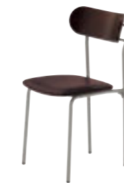
コトル SI-1N ¥27,100 張材:レザー-B-29 (No.4)